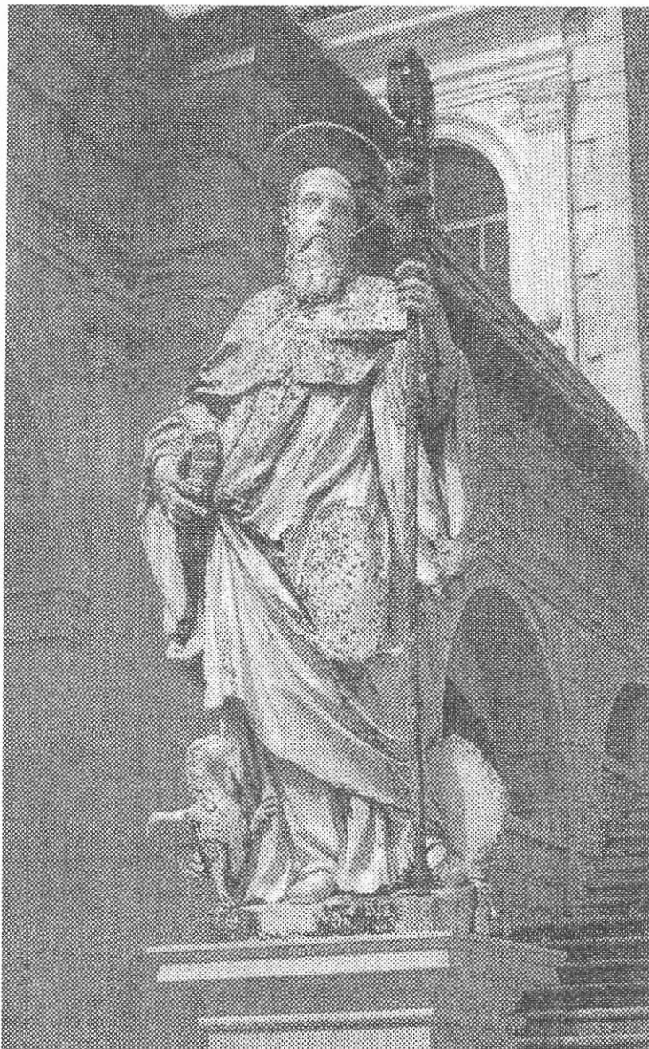
Benediktova socha na kláštornom dvore na Montecassinu, (Talianско) Benedikt, opát, patrón Európy (11. júl)